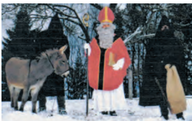
St. Nikolaus und Knecht Ruprecht

Am 6./7. und 8. Dezember 2024 besucht St. Nikolaus mit seinen Gehilfen wieder die Familien in unserer Gemeinde. Wer den Besuch von St. Nikolaus bei sich daheim wünscht, melde sich unter 071 983 07 02 oder per Email: chlauszentrale@gmail.com