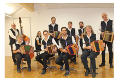
'Echo vom Züchle und Stosse